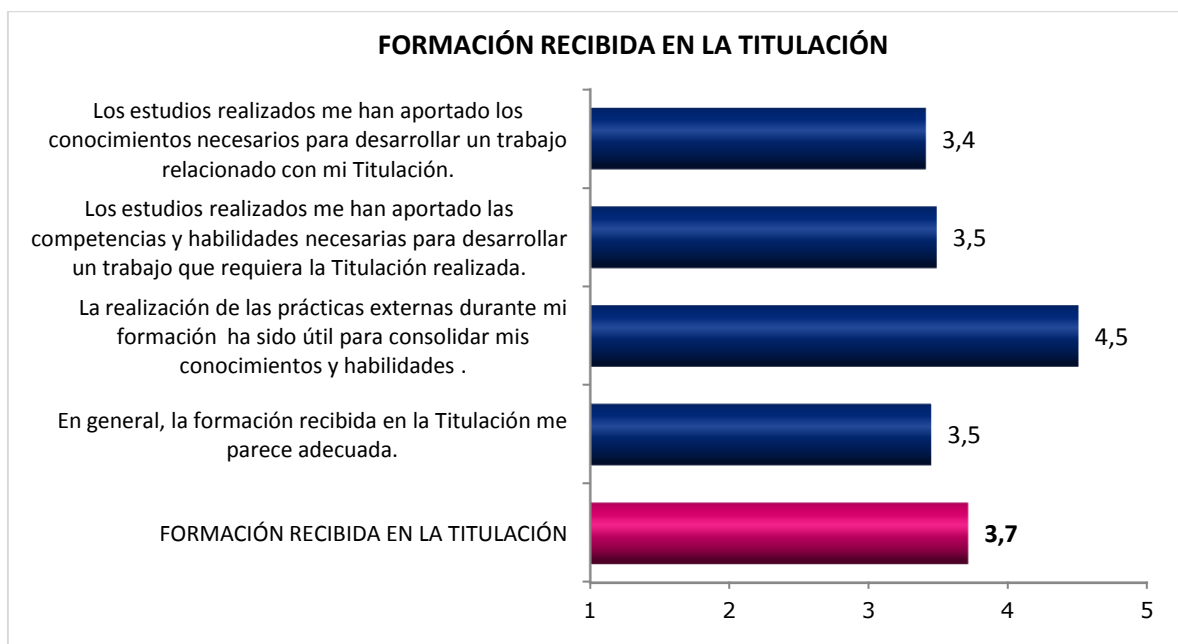
Gráfico 2. Formación recibida en la titulación en el Grado de Educación Infantil.

Todos los ítems evaluados reciben una puntuación de 3,5 o superior sobre 5 excepto el ítem “Los estudios realizados me han aportado los conocimientos necesarios para desarrollar un trabajo relacionado con mi Titulación” que obtiene la puntuación más baja 3,4.